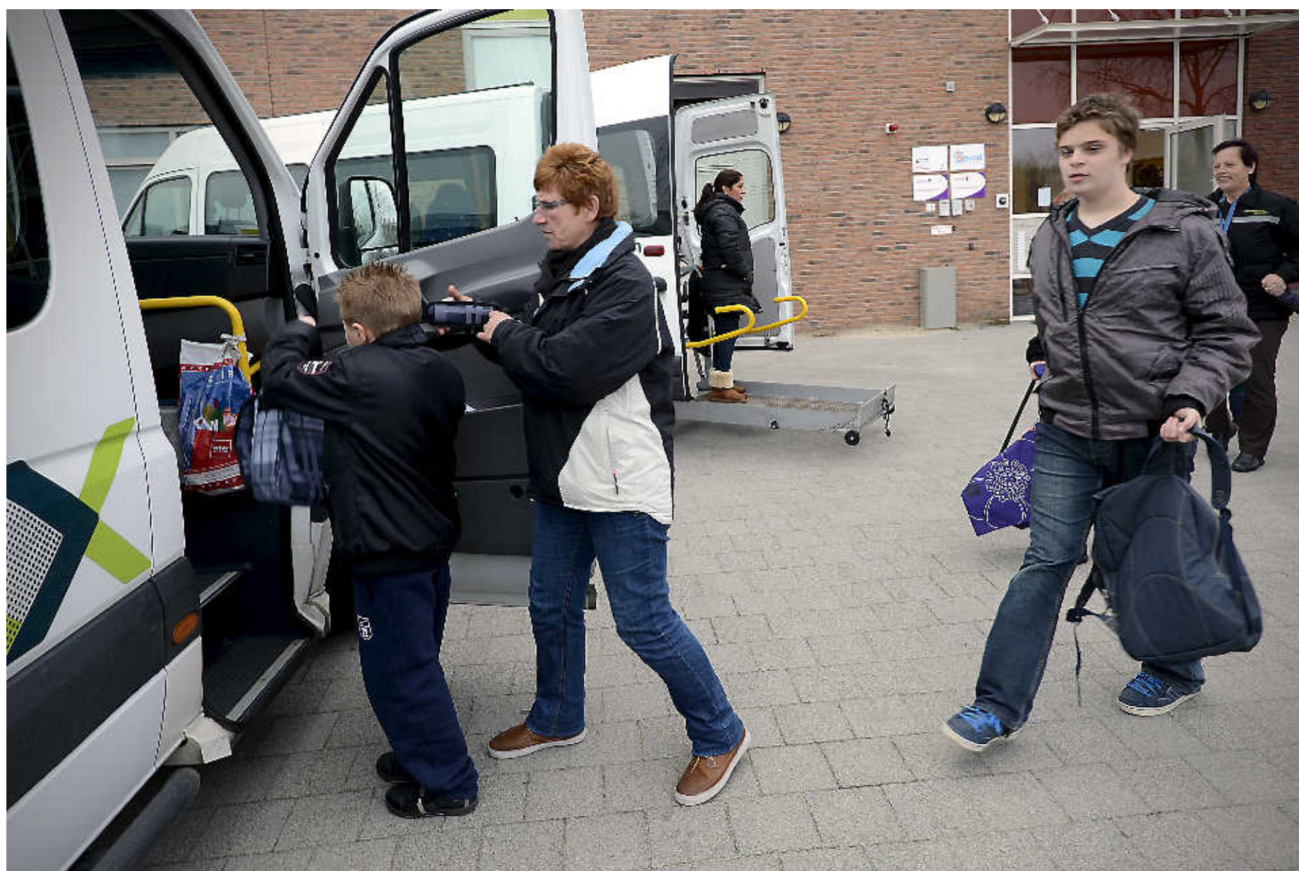
Kinderen worden met busjes opgehaald van de dagbesteding bij de Boomgaard.

Vorig jaar zijn ze in mei - sinds jaren - voor het eerst een week op vakantie geweest. Zonder haar zoon.