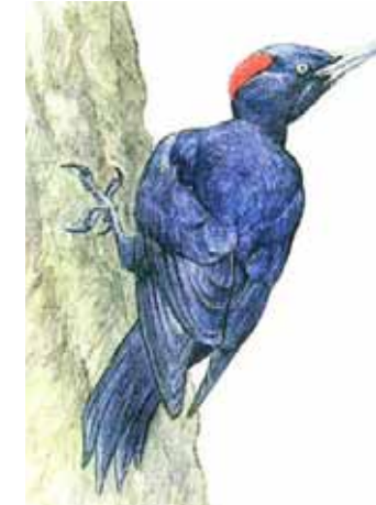
Een zwarte specht.

Behalve de huurwagen van het beroemde strijkkwartet werden woensdag nog twee auto's in De Appelaar opengebroken, aldus de politie.